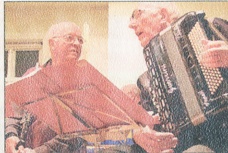
Två orkestermedlemmar samspråkar innan repetitionen drar igång på allvar.