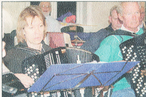
Den yngsta orkestermedlemmen i dragspelsklubben är cirka 50 år.